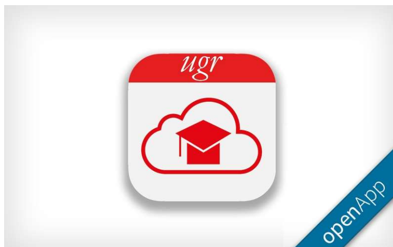
Figura 1: Identificación de openApps en https://apps.ugr.es

Adicionalmente, en el catálogo disponible en http://apps.ugr.es , se indicará sobre las aplicaciones de las tres categorías anteriores cuales de ellas son aplicaciones con código liberado, ( openApp ). El código de estas aplicaciones se dejará con licencia abierta y su mantenimiento será responsabilidad exclusiva de sus autores. La UGR no se responsabilizará de las mismas. Es requisito para aparecer bajo esta etiqueta que se pueda certificar los datos de liberación del código y que se informe de ello (URL de la forja, tipo de licencia, etc.) en la vista Acerca de .